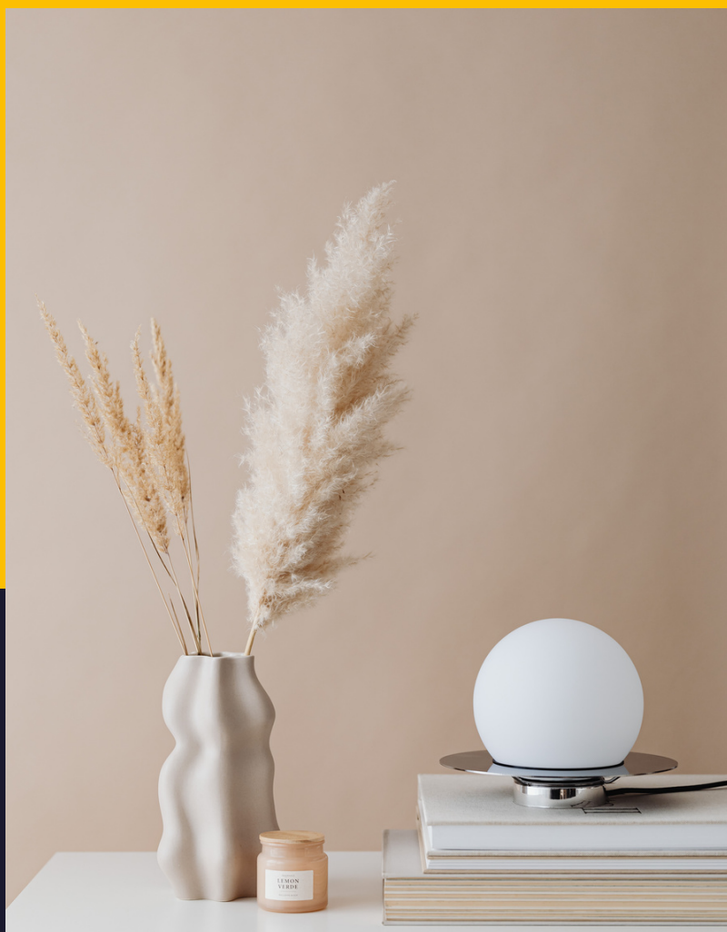
Nauja internetinė svetainė